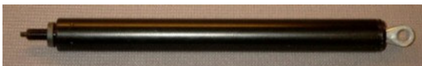
Skum-ring om stempel